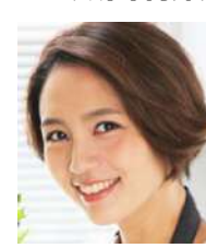
和田明日香 (料理家)