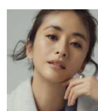
クリスウェブ佳子